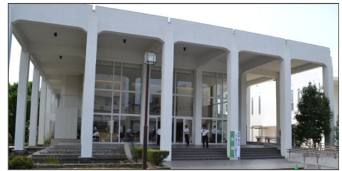
長崎大学医学部記念講堂

[お問合せ先] ながさき健康・省エネ住宅推進協議会事務局 ☎ 0957-26-3217